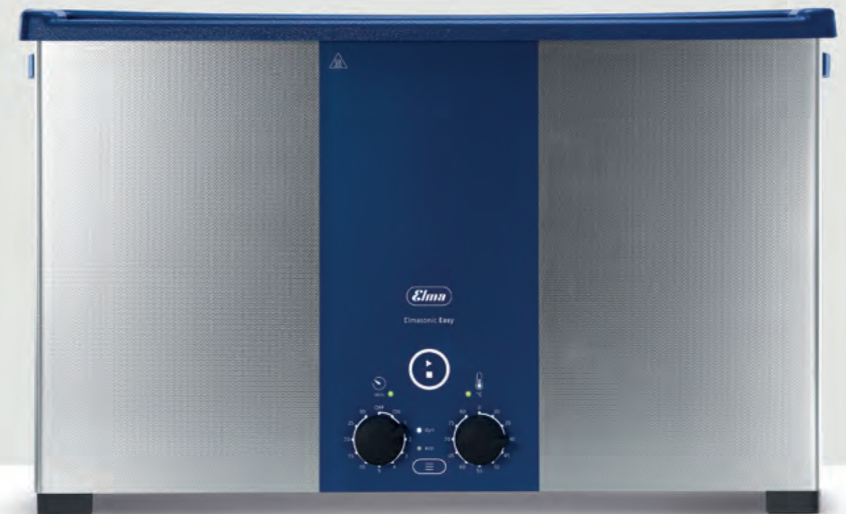
Elmasonic Easy 300H Volume total (V) : 27,5 l Puissance des ultrasons (W) : 300