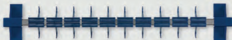
Porte-bijoux Matériau : plastique