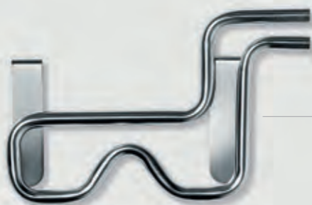
Serpentin de refroidissement Matériau : acier inoxydable

La technique d'Elma est bien plus que de simples appareils pour le nettoyage. Nos accessoires vous permettent de compléter la série Easy – simple et pratique.