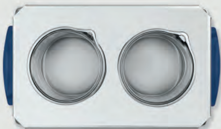
Couvercle pour compartiment Matériau : acier inoxydable