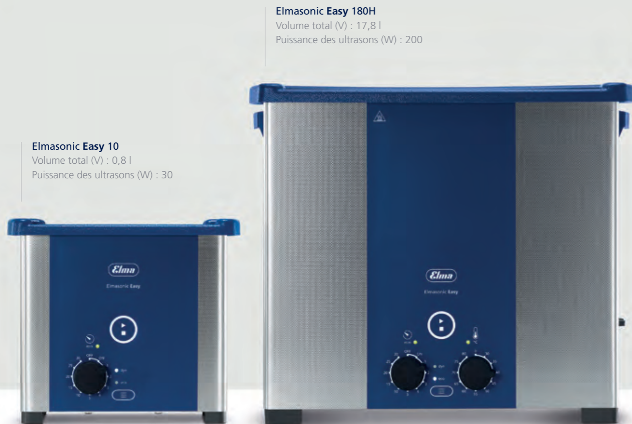
Elmasonic Easy 10 Volume total (V) : 0,8 l Puissance des ultrasons (W) : 30