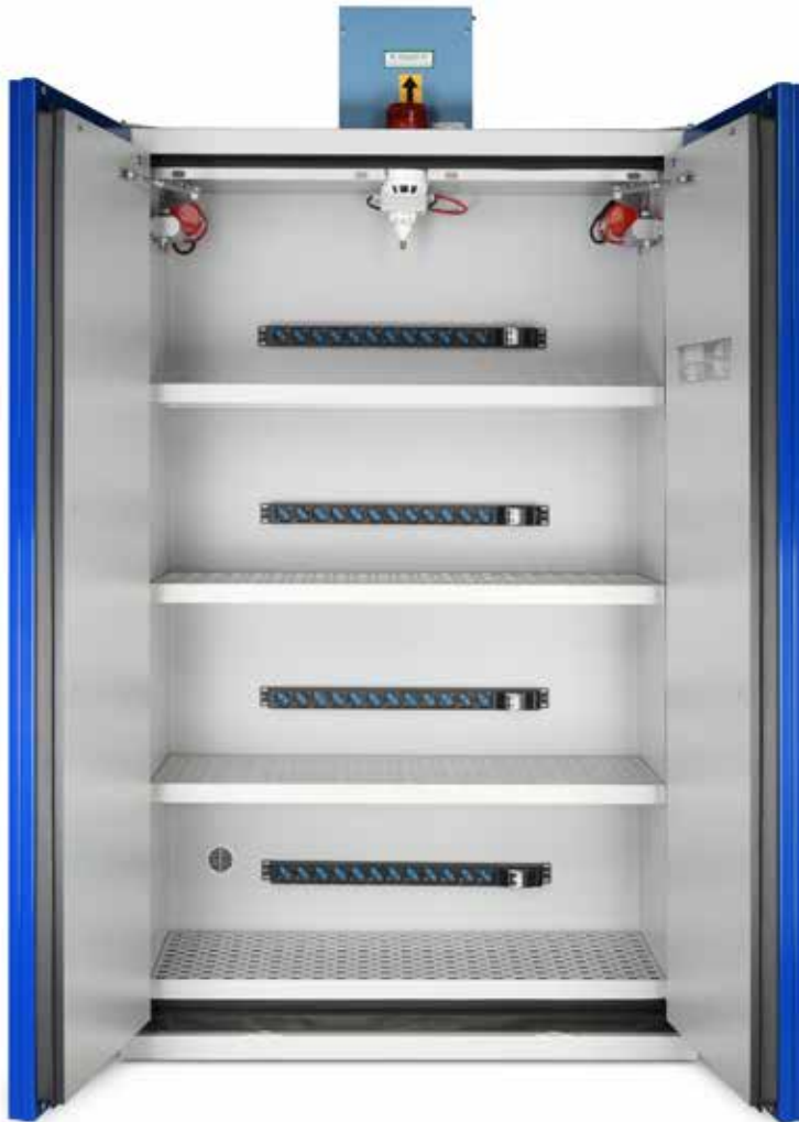
EOF232L4CP + DIAM125BP

RÉSISTANCE AU FEU CERTIFIÉE 90 minutes (TYPE 90)