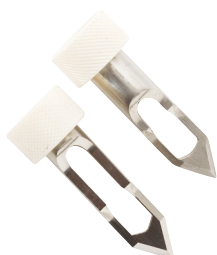
FC098 et FC099 Lames en acier inox pour électrodes pH spéciales viandes (en option)