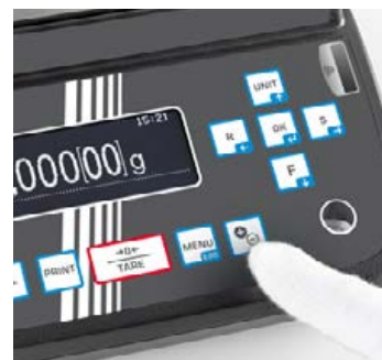
Ionisateur (inclus) activable en appuyant sur un bouton