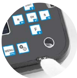
Ouverture possible à l'aide d'un bouton