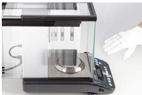
Portes coulissantes automatiques, qui s'ouvrent et se ferment à l'aide de capteurs

Balance d'analyse KERN ABP-A - Caractéristiques & accessoires de la nouvelle série de modèles