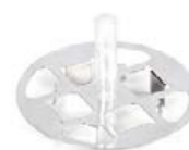
Plateau de pesée multifonction inclus pour modèles avec [d] = 0,01 mg

KERN ABP-A avec ionisateur intégré et chambre de protection interne