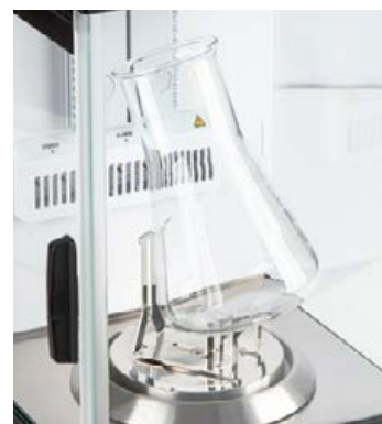
Support de fiole Erlenmeyer, inclus dans la livraison pour ABP 200-5M et ABP 300-5AM