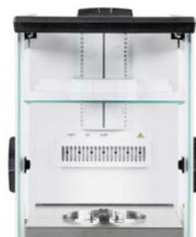
Chambre de protection interne - minimise l'effet des flux d'air dans la chambre de pesée, uniquement pour les modèles 0,01 mg de la série ABP-A