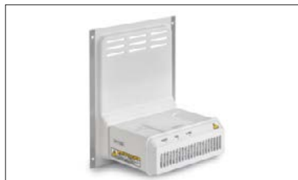
2 Face arrière de la chambre de protection avec ionisateur intégré qui peut être monté de façon permanente à la place du pare-brise arrière existant