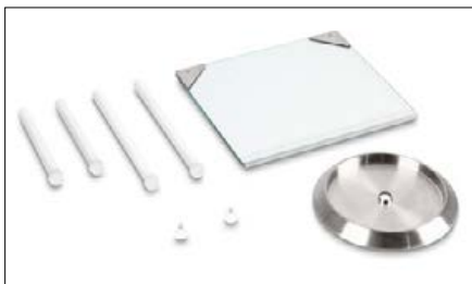
1 La chambre de protection interne réduit l'effet des flux d'air dans l'espace de pesée et améliore ainsi clairement le temps de stabilisation et la répétabilité.

Balance d'analyse premium avec la dernière génération Single-Cell pour des résultats de mesure extrêmement rapides et stables - désormais disponible en version avec portes coulissantes automatiques