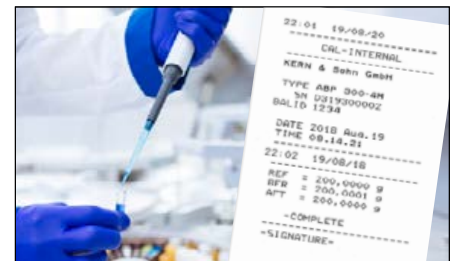
Protocole GLP/ISO professionnel et détaillé, la balance est ainsi pleinement conforme aux exigences des normes ISO, GLP et GMP