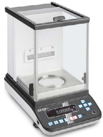
2 KERN ABP 100-5DM avec ionisateur optionnel

Balance d'analyse premium avec la dernière génération Single-Cell pour des résultats de mesure extrêmement rapides et stables - désormais disponible en version avec portes coulissantes automatiques