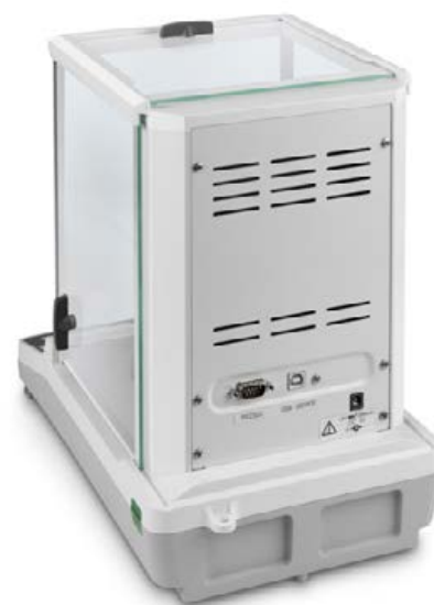
KERN ACS/ACJ avec interface de données standard RS-232 et USB

Le best-seller des balances d'analyse, avec un système de pesage de qualité supérieure Single-Cell, également avec approbation d'homologation [M]