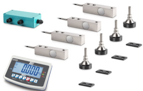
Figure : Série CW KFB avec dispositif d'évaluation