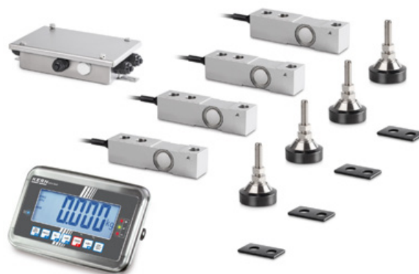
Figure : Série CW KFN avec dispositif d'évaluation