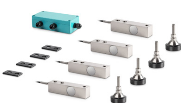
Figure : Série CW sans dispositif d'évaluation