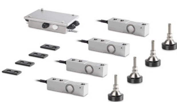
Figure : Série CW R sans dispositif d'évaluation