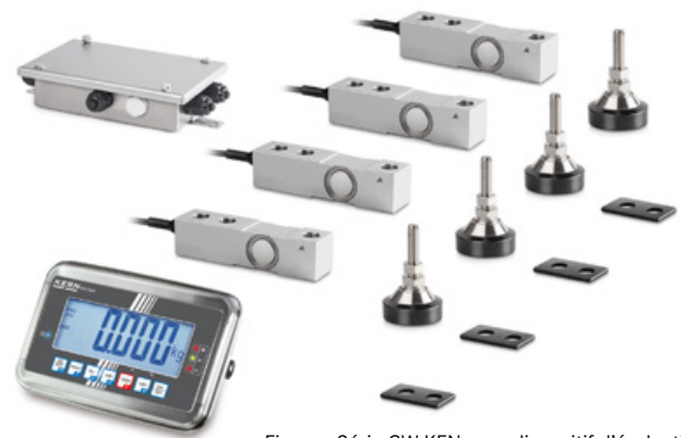
Figure : Série CW KFN avec dispositif d'évaluation