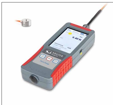
SAUTER FS OY1