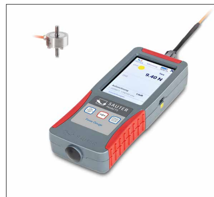
SAUTER FS OY2

Pour mesures de force de traction et de compression