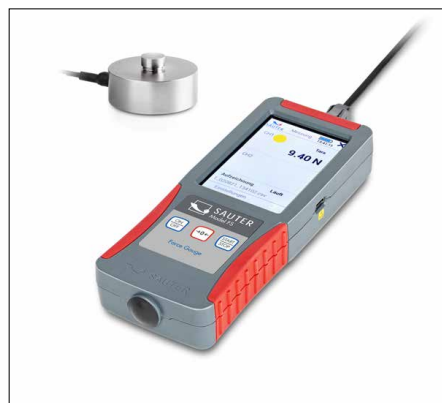
SAUTER FS RQ1

Sets de dynamomètres SAUTER FS SP1 · FS RY1 · FS RQ1 · FS OY1 · FS OY2