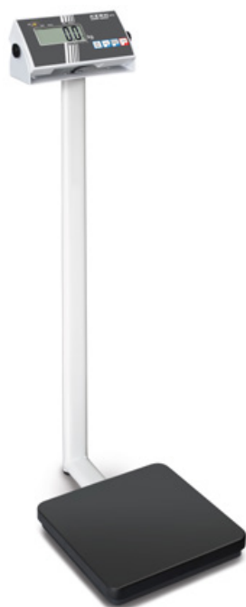
KERN MPB-P avec colonne