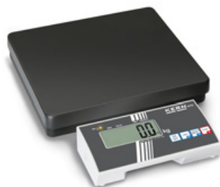
KERN MPB avec afficheur autonome