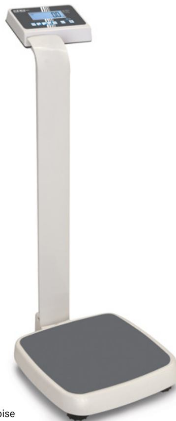
KERN MPE-P avec colonne