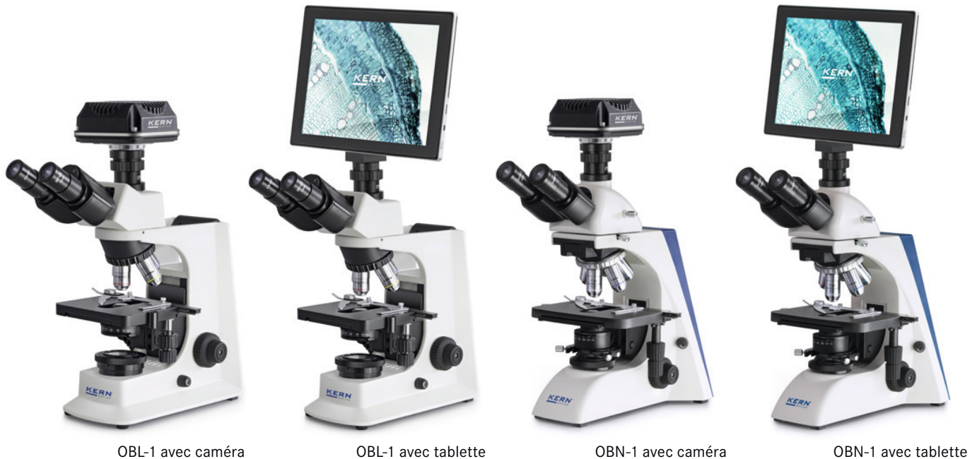
OBL-1 avec caméra

Ensembles de microscopes numériques KERN OBL-S · OBN-S