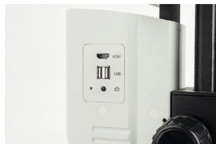
OIV 254 Bouton capture d'écran

La solution numérique complète pour un confort de travail accru lors des observations longues dans l'industrie