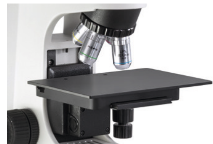
Platine et objectifs