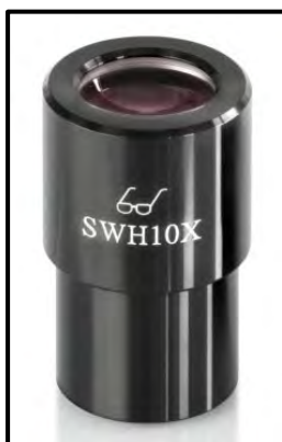
Oculaire à point d'observation élevé (reconnaisable au symbole des lunettes)