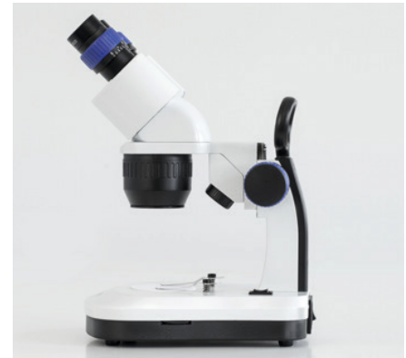
Vue de côté