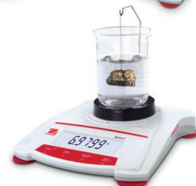
Scout illustrée avec le kit de détermination de densité en option