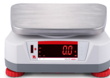
Afficheur arrière avec capteur sans contact intégré