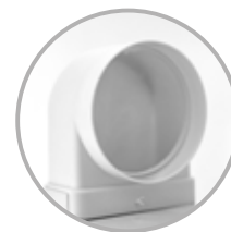
collecteur d'aération (CMD200)

Hottes et armoires à filtration - Ventilation