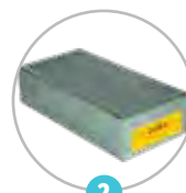
Filtre à charbon actif spécialisé