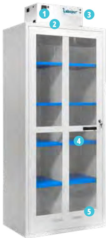
▲ AFP22 + CORGFC