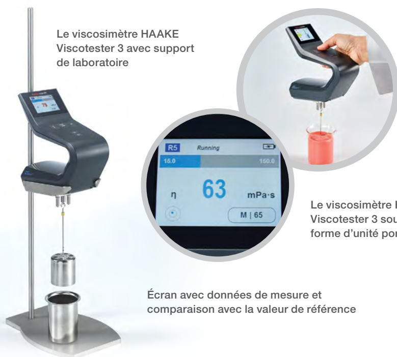
Le viscosimètre HAAKE Viscotester 3 avec support de laboratoire

Un rotor tournant à une vitesse constante est immergé dans le fluide à tester. La résistance du fluide à cette rotation est mesurée et convertie en mesure de viscosité.