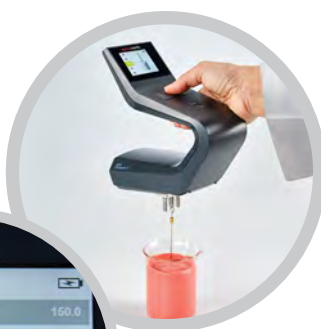
Le viscosimètre HAAKE Viscotester 3 sous forme d'unité portable