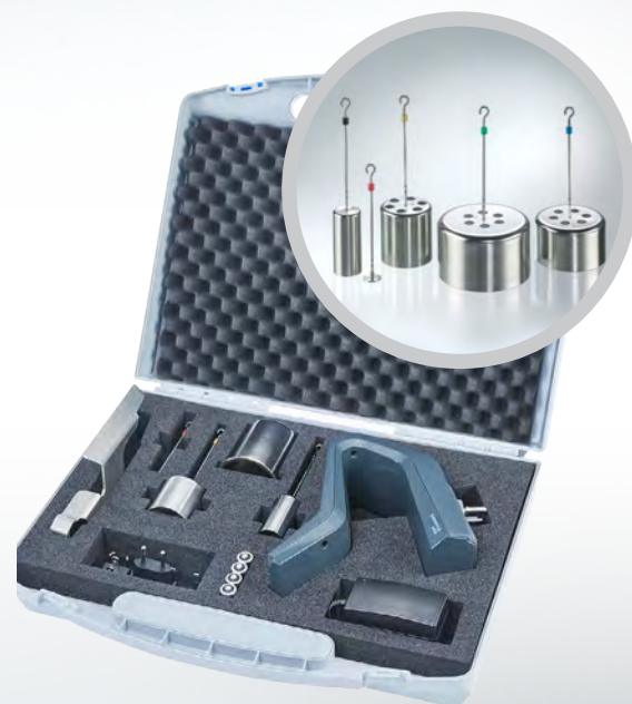
Codage couleur de la coupelle avec « Select assist »

Le viscosimètre HAAKE Viscotester 3 incarne la facilité d'utilisation de différentes manières. Avec son design unique, l'instrument se positionne automatiquement dans un alignement correct, qu'il soit tenu à la main ou posé sur un support de laboratoire. Son raccord rapide permet un échange intelligent des rotors. En outre, des conseils d'utilisation sont fournis au moyen de formes géométriques avec un codage couleur ainsi que d'un indicateur de plage de mesure. En outre, la fonction « Memory Assist » permet à l'utilisateur de comparer rapidement et facilement la viscosité mesurée avec une valeur de référence.